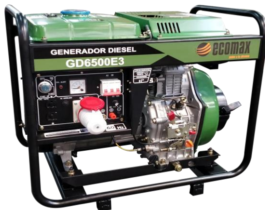
Fotografía de referencia, podría cambiar algunas de sus características sin afectar su funcionalidad, La información contenida en esta publicación está basada en el modelo más reciente y contiene la información disponible al momento de la impresión de la ficha. Nos reservamos el derecho de realizar cambios en las especificaciones del equipo en cualquier momento sin incurrir en la obligación de informarlo.

Generador Diésel Marca Ecomax con regulador "AVR"