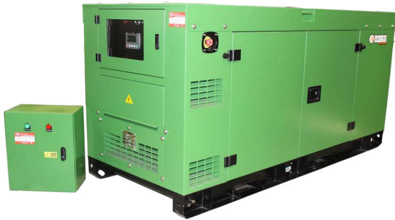
Fotografía de referencia, podría cambiar algunas de sus características sin afectar su funcionalidad, La información contenida en esta publicación está basada en el modelo más reciente y contiene la información disponible al momento de la impresión de la ficha. Nos reservamos el derecho de realizar cambios en las especificaciones del equipo en cualquier momento sin incurrir en la obligación de informarlo.