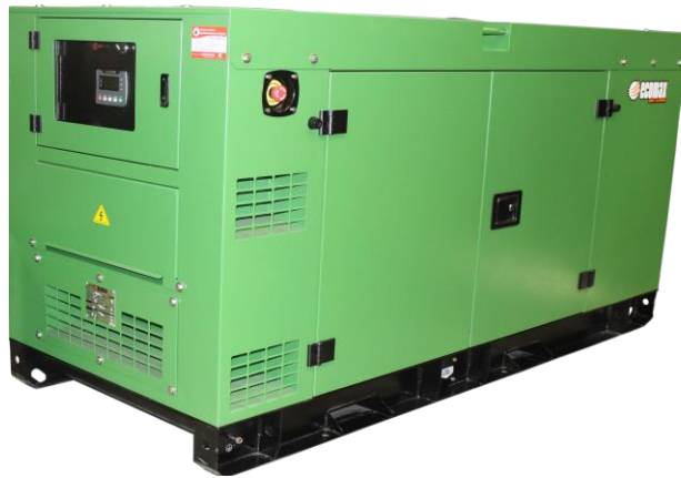
Fotografía de referencia, podría cambiar algunas de sus características sin afectar su funcionalidad, La información contenida en esta publicación está basada en el modelo más reciente y contiene la información disponible al momento de la impresión de la ficha. Nos reservamos el derecho de realizar cambios en las especificaciones del equipo en cualquier momento sin incurrir en la obligación de informarlo.