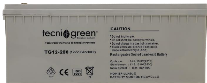
Fotografía de referencia, podría cambiar algunas de sus características sin afectar su funcionalidad.

Batería Ciclo Profundo, Plomo ácido, libre de mantenimiento válvula VRLA, para aplicaciones con energía solar. Diseñadas para trabajar con descargas profundas de acuerdo a la gráfica